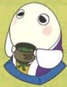
まゆまる まゆまる 260003