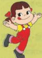
ベコちゃん